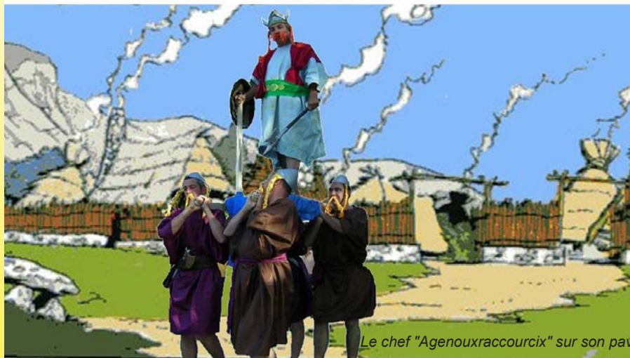
Le chef "Agenouxraccourcix" sur son pavbis

Souhaitons que la fête 2006 connaisse la même réussite !