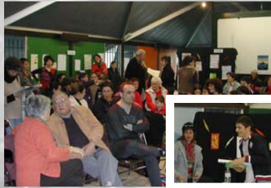
Remise des prix devant un public nombreux