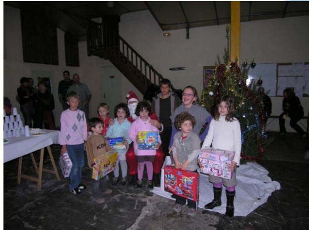
Les enfants comblés de cadeaux