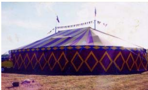
Le chapiteau de la compagnie