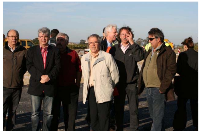
Lors de la visite de chantier

Démarré au mois d'août, le rond point situé à la sortie ouest du village est enfin opérationnel. Le giratoire permet de sécuriser l'entrée ouest de la commune et facilitera les accès à la future ZAC communale et à Raissac sur Lampy lorsque la déviation sera opérationnelle.