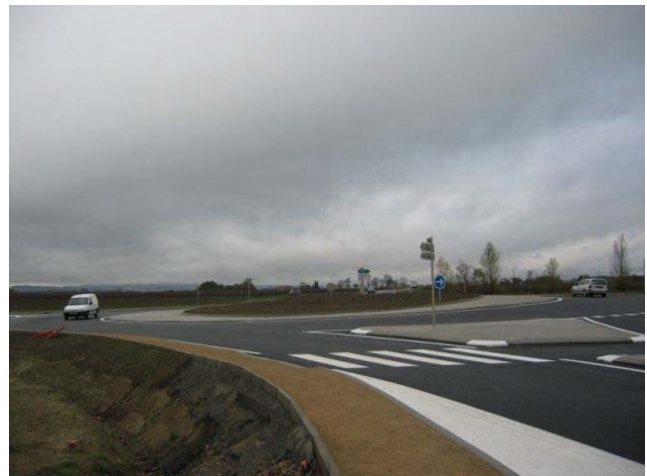
Le giratoire terminé

Pour un montant de 780 000 €, ce projet, a été réalisé par un groupement d'entreprises SACER/ CAZAL.