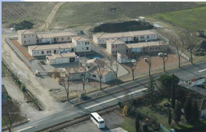
La nouvelle gendarmerie vue d'avion