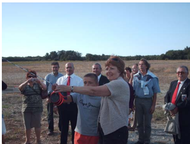
Lors de l'inauguration du nouvel abri

L'assemblée générale du Ball-trap club Alzonnais a eu lieu le vendredi 27 novembre à 19 h 15 au restaurant scolaire.