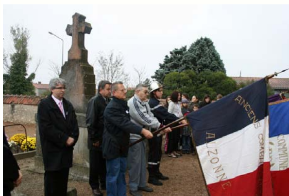
Recueillement au cimetière

Un apéritif était ensuite offert à la population.