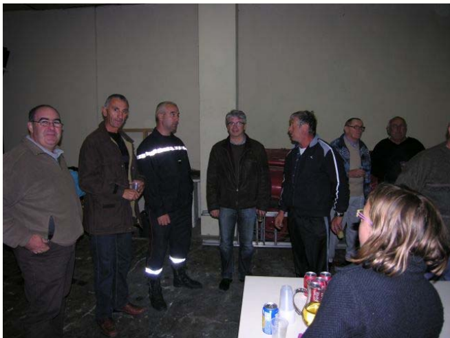
Le conseiller général visite la caserne

A l'issue de ce repas apprécié de tous et de l'échange d'anecdotes lors des mobilisations, chacun se retira satisfait de cette soirée.