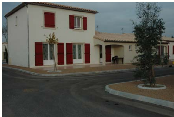
Des locaux fonctionnels et bien équipés

premier adjoint en charge des finances soulignait l'exemplarité du montage du dossier qui avoisine les 3 millions d'euros : grâce aux dotations pour le développement rural accordées par l'Etat, 370 000 €, la contribution du ministère de la Défense, 251 000 € ainsi que la vente par la commune de son ancienne gendarmerie, la participation de la commune reste une charge raisonnable. Un emprunt de 1,2 M€ a permis de boucler le financement sans compromettre notre avenir puisqu'il sera remboursé par le loyer.