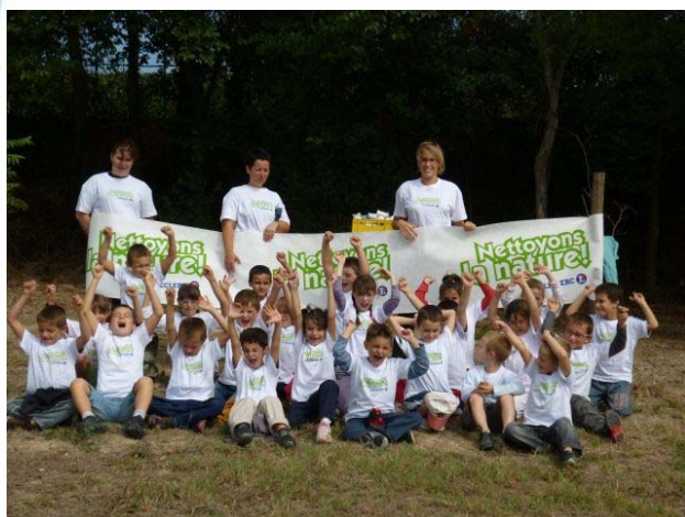
Les enfants avec leur maîtresse et les accompagnatrices