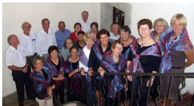
La chorale avant le concert