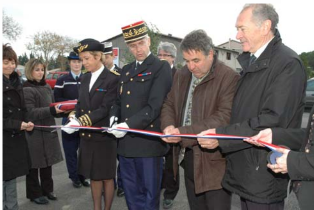
La coupe du ruban par les autorités