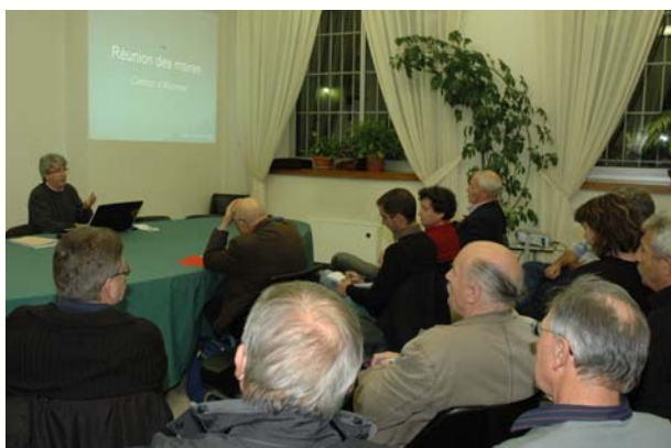
Les maires attentifs pendant l'exposé des nouvelles réformes

Une quinzaine d'élus a participé, dans la salle du conseil de la Mairie d'Alzonne, à cette séance qui a permis à notre représentant local de rappeler les compétences obligatoires et facultatives d'un conseil général. Il a souligné les problèmes budgétaires que rencontrent les conseils généraux suite aux transferts de compétences de l'Etat vers les collectivités locales.