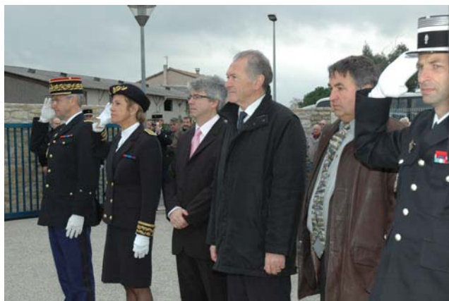
Sous l'œil des autorités

Malgré un vent marin persistant, le public est venu nombreux : habitants de la commune, architecte, géomètre et représentants des entreprises, retraités et réservistes de la gendarmerie, ainsi qu'une forte représentativité des maires et conseillers municipaux des 20 communes de la circonscription de la communauté de brigade.