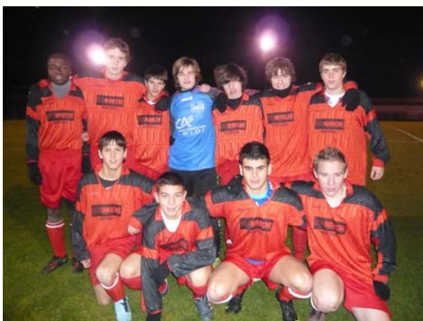
Les Vétérans - Responsable : N. SMETS

mi-temps pour les Alzonnais. A retenir que c'est la première fois qu'une équipe arrive à ce niveau. Elle est toujours en course en Coupe de l'Aude où elle va rencontrer prochainement l'équipe de Coursan.