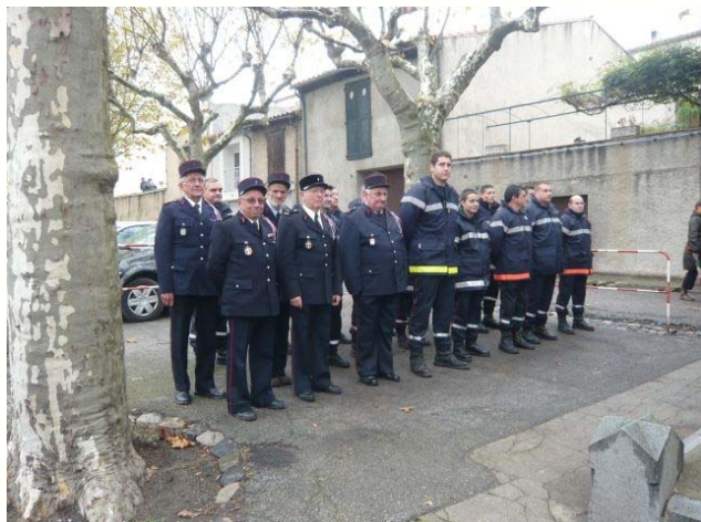
Les sapeurs lors de cérémonies officielles